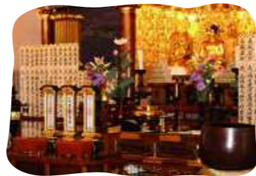
盂蘭盆会 合同法要