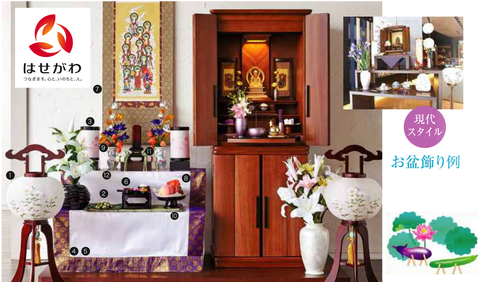
現代スタイル お盆飾り例