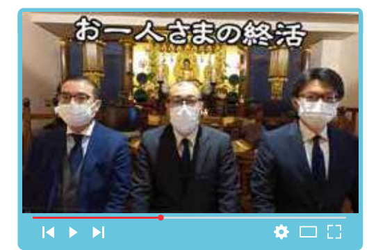
第一部「死後事務委任」(しごじむいにん) 第二部「遺言」(ゆいごん) 公正証書遺言

以前より多くのお問い合わせがありました「おひとりさま」における終活の動画を配信しています。内容は「死後事務委任」や「遺言」という本人が亡くなった後に大切になるテーマ。どちらもお役立ていただけると思います。