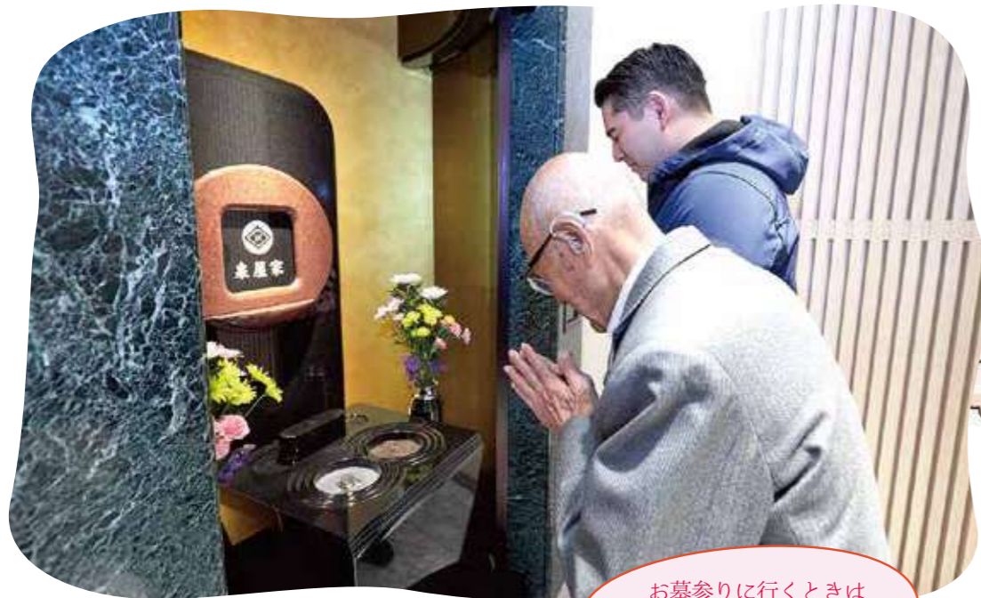
お墓参りに行くときはいつも孫が車で送ってくれます

毎日を元気に過ごす! そんなご購入者様の日常を紹介する、このコーナーにご登場頂ける方を募集いたします。詳しくは下記までお問い合わせください。 0120-985-418