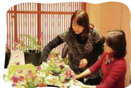
フラワー アレンジメント教室