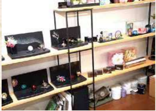
サライオリジナルご供養グッズの数々