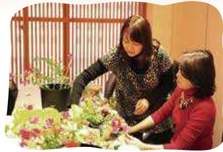
フラワー アレンジメント教室