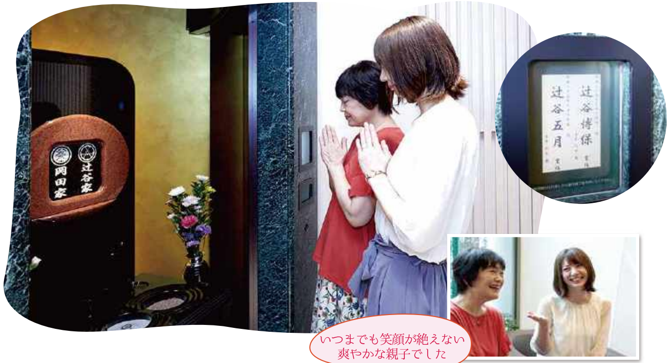
いつまでも笑顔が絶えない 爽やかな親子でした

毎日を元気に過ごす! そんなご購入者様の日常を紹介する、このコーナーにご登場頂ける方を募集いたします。詳しくは下記までお問い合わせください。 0120-985-418