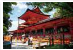
ご予約者様旅行企画