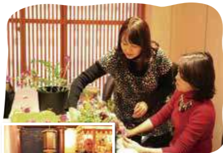
フラワー アレンジメント教室