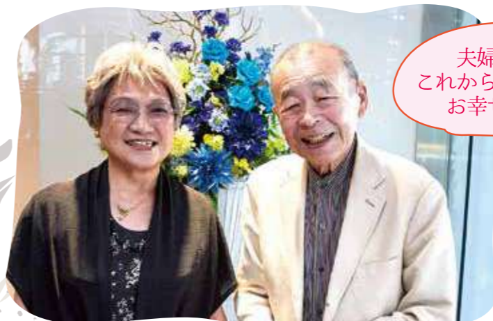
夫婦円満 これからもお二人 お幸せに…

いでしょ。私は建設省を定年退職した後もゼネコンの役員や財団法人の理事長として79歳まで働いていました。現在は俳句や詩吟、習字などを皆さんと楽しんでいます。 奥様…私は高校、大学と水泳選手だった関係で地元のスイミングスクールのコーチをしておりまして。60代で泳ぐことはやめました。総務省や警察関係のボランティア活動をしています。 ご主人…年を取ると外出をしない高年齢者も多いそうですが、我が家はそんなことはありません。今日のインタビューも楽しみにして来ましたが、その意味では、赤坂浄苑では、ただお墓を持つだけではなく、様々なかたちで接点を持っていきますし、それがいい刺激になっています。 「本日はありがとうございました。」