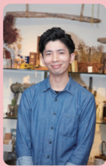
good face 12