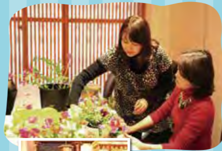
フラワー アレンジメント教室