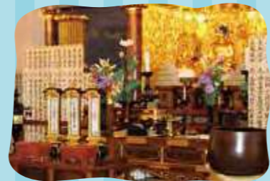
盂蘭盆会 合同法要