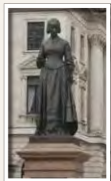
英国 ウォータールー広場 ナイチンゲール像

その後、ナイチンゲールは 現地で得た多くのデータをも とに陸軍の衛生政策や組織の 変革を提案し実現。ナイチン ゲール看護学校という学校を 作り、その運営面や指導面 にも携わりました。彼女は、日 本人とも交流がありました。 たとえば女子英学塾（津田塾 大学）を創設し、日本の女子 教育の先駆者とされ、新5千 円札に登場する津田梅子は彼 女と会うことを熱望し、滞英 中にその夢を叶えました。 1910年8月13日、90歳と いう長寿でこの世を去ったナ イチンゲール。遺言ではあり ませんが墓に刻んだのは名前 ではなく、自分のイニシャル である「F・N」。有名にな ることを嫌った彼女らしさが そこに現れています。