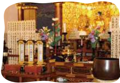
盂蘭盆会 合同法要