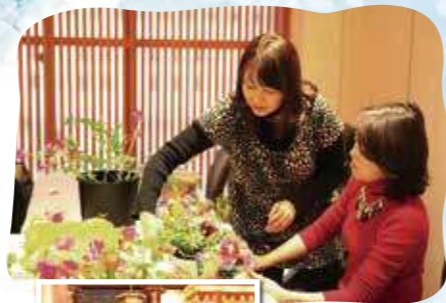
フラワー アレンジメント教室